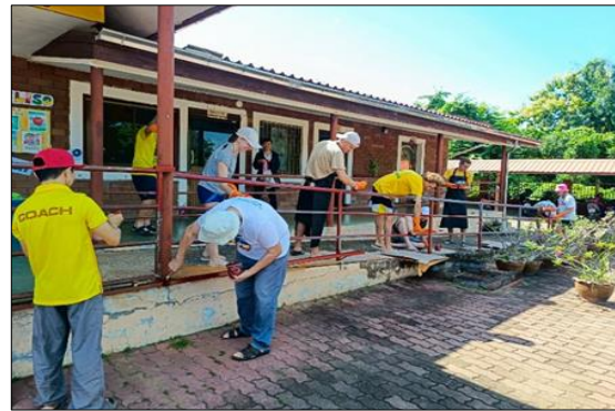
จิตอาสาจากประเทศอิตาลีมาจัดกิจกรรมจิตอาสาปรับปรุงอาคาร