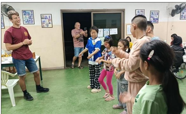
คณะครูและนักศึกษาจากวิทยาลัยอาชีวศึกษา จ.แพร่